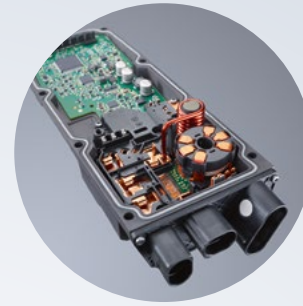
Schweißen von Steuergeräten